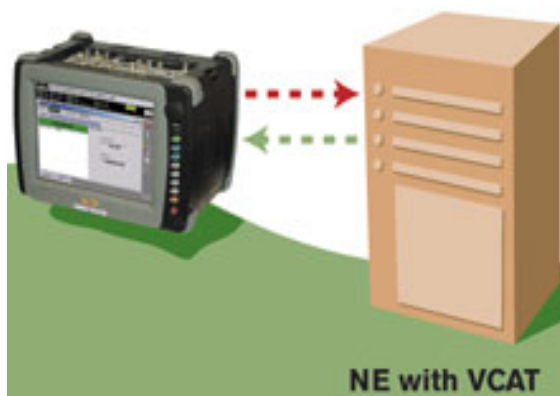
Figura 1: Prueba de VCAT

como tráfico independiente, y ser reensamblados en los puntos terminales. Hasta un 93% de eficiencia de ancho de banda se consigue cuando se optimiza el grupo de concatenación virtual (descrito a continuación) basado en la carga o payload. Por ejemplo, transportar una carga de Ethernet 10M eficientemente implica el uso de 5 contenedores virtuales del tipo VC12a (SDH) o 7 del tipo VT1.5s (SONET), en comparación con el uso de los ductos tradicionales del tipo VC3 o STS-1 SPE en los cuales la eficiencia alcanza apenas el 20 por ciento; VCAT alivia la necesidad de expandir la capacidad de la red mientras se minimizan los cambios de la infraestructura existente (ver Figura 1).